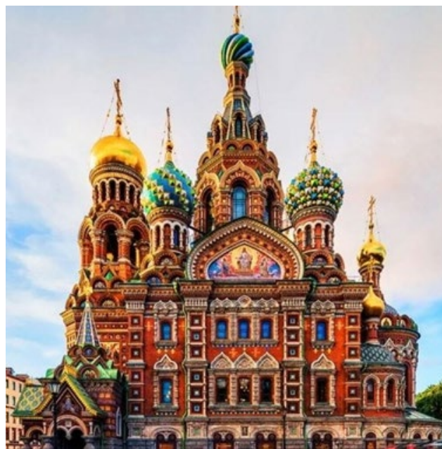
Храм Спаса на Крови

Храм Спаса на Крови построен в память о трагических событиях – гибели российского императора Александра II – освободителя. Храм очень богато украшен в русском стиле, как снаружи, так и внутри. При отделке использовалось много уральских самоцветов. Подобного храма нет нигде в мире.